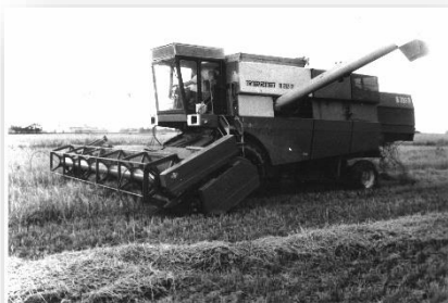
Labības kombains Fortschritt E 516B (1987.gads).

SIA “Sertifikācijas un testēšanas centrs” ir dibināts 1911.gadā. pagājušajā gadā svinējām 110 gadu jubileju.