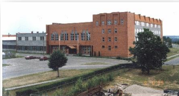
Baltijas MIS galvenā ēka, celta 1989.gadā.