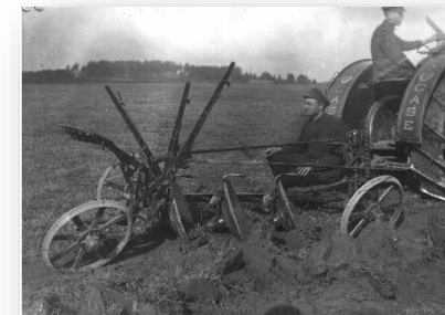
Traktora “ CASE ” un šķīvju arkla izmēģināšana (1922.gads).

SIA “Sertifikācijas un testēšanas centrs” ir akreditēta institūcija ar profesionālu un kompetentu ekspertu komandu bioloģiskās lauksaimniecības apstrādes (EN ISO/IEC 17065), apmācību, testēšanas (EN ISO/IEC 17025), pārbaudes (EN ISO/IEC 17020) un mašīnu, iekārtu, kā arī ražošanas un traktortehnikas atbilstības novērtēšanu. Mūsu uzņēmums darbojas vairākos virzienos, kas ļauj piedāvāt klientiem plašu kvalitatīvu pakalpojumu klāstu.